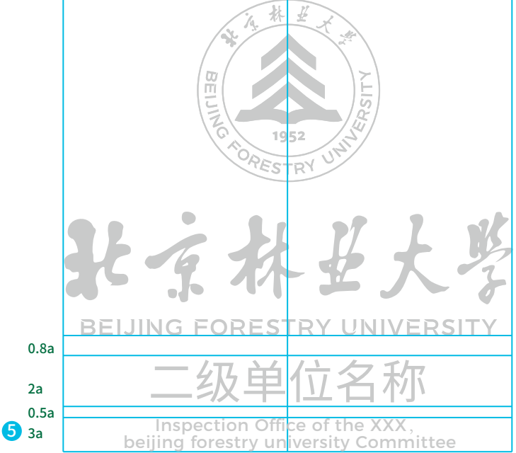
二级单位英文两行情况