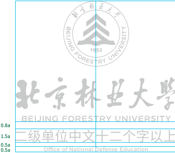
二级单位中文名称十二个字以上